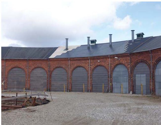
Viborg Stations Lokomotivremise: Istandsættelse af den fredede lokomotivremise opført i etaper fra ca. 1889 til omkr. 1933. Igangværende.