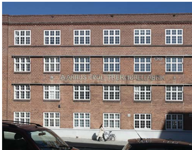
Aarhus Polstrørmøbelfabrik: Omdannelse af den bevaringsværdige møbelfabrik opført 1918 til attraktive byboliger. Igangværende.