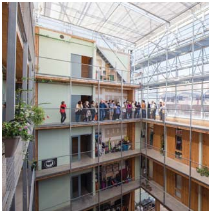
Mies van der Rohe Prisen 2022, side 10