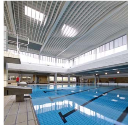
Teglværkskrogen 4, Asnæs, side 20