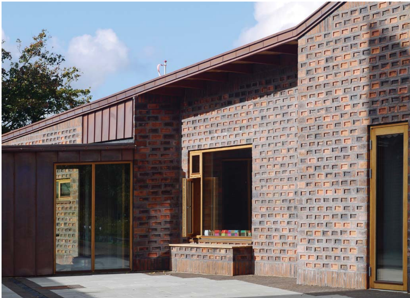
Mejdal Kirke: Til- og ombygning, Holstebro. 2018

går i min såkaldte fritid. En anden stor del af mit arbejde foregår ude i verden, i samvær og samarbejde med skønne mennesker. Her får jeg dækket min oplevelsestrang og mit sociale behov fuldt ud. Tingene flyder altså frit sammen, og meget af mit faglige engagement kan jeg ikke direkte sende regninger på. Er det så fritid eller arbejde?