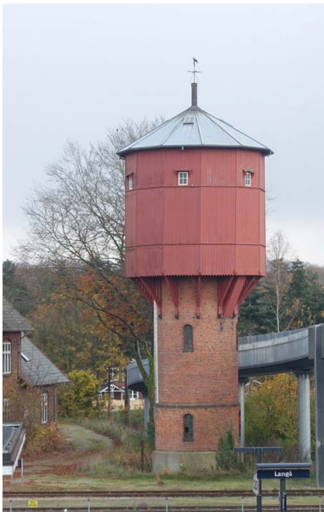
Langå Vandtårn: Istandsættelse af Langå Stations bevaringsværdige vandtårn fra 1908 og formidling af tårnets historie, funktion og stemning. Igangværende.